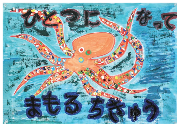
昨年の全国ポスター作文コンクールにおいて特賞に入賞した 市内小学1年生の作品

私たちの住む地域から平和で自然環境の豊かな世界を目指して、自分たちのできる活動を一緒にしてみませんか。